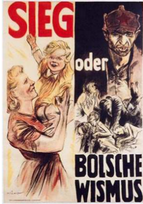
Affiche de propagande nazie : 'La victoire, ou le bolchévisme'

« Si le Juif, grâce à sa religion marxiste, arrive à vaincre les autres peuples de ce monde, sa couronne sera la couronne funéraire de l'humanité et la planète évoluera dans l'univers, comme elle le fit il y a des millions d'années, sans êtres humains. » (Adolf Hitler, Mein Kampf .)