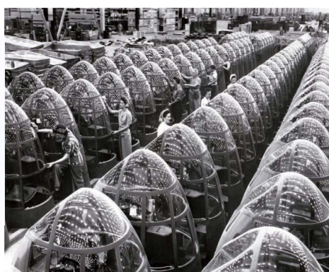
Usine de production de bombardiers en Californie, octobre 1942.