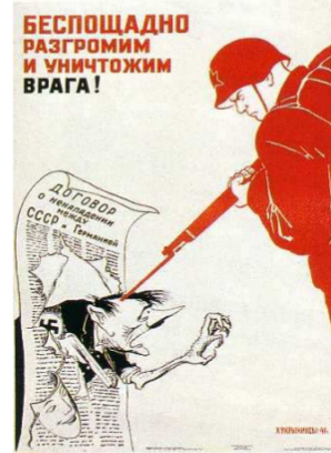
Affiche de propagande communiste : «Écrasons et détruisons l'ennemi sans pitié ! (en haut). Pacte de non-agression entre l'URSS et l'Allemagne (sur la feuille)»

« Si le Juif, grâce à sa religion marxiste, arrive à vaincre les autres peuples de ce monde, sa couronne sera la couronne funéraire de l'humanité et la planète évoluera dans l'univers, comme elle le fit il y a des millions d'années, sans êtres humains. » (Adolf Hitler, Mein Kampf .)