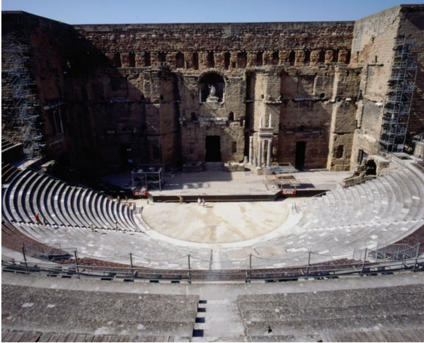
Théâtre de l'antiquité