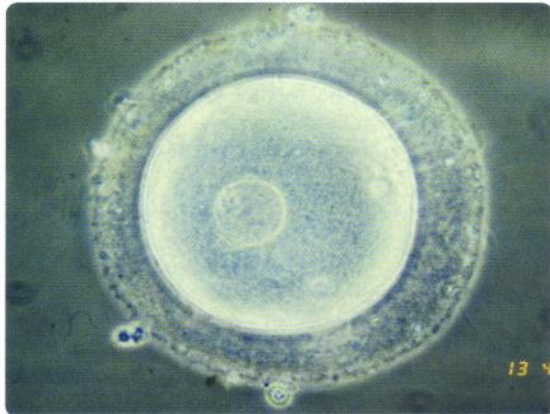
a. Ovule ( \times 1200 ).

Chaque ovule est une cellule dont le cytoplasme est gorgé de réserves.