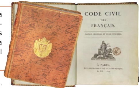
Première édition du Code civil, 1804.

La Première République naît en 1792 après la chute de la monarchie et s'achève en 1804 avec la proclamation de l'Empire par Napoléon Bonaparte. Durant cette période, plusieurs expériences politiques se succèdent. Les derniers mois de la République sont marqués par la parution du « Code civil » qui unifie le droit de la nation et transforme la société française.