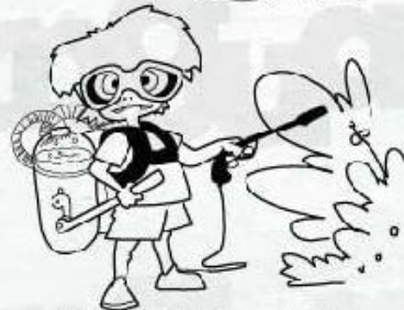
No usar productos químicos.