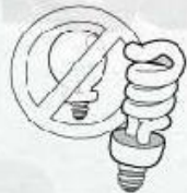
Usar bombillas de bajo consumo.