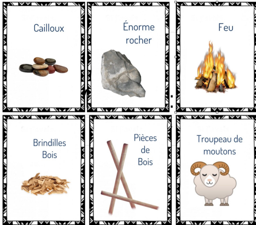
Cartes Ruse 1