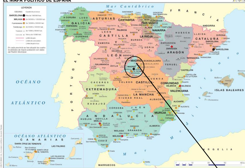
EL MAPA POLÍTICO DE ESPAÑA

2° - Realiza el ejercicio: Señala ¿De qué región es? Y escribe la frase con sus gustos.