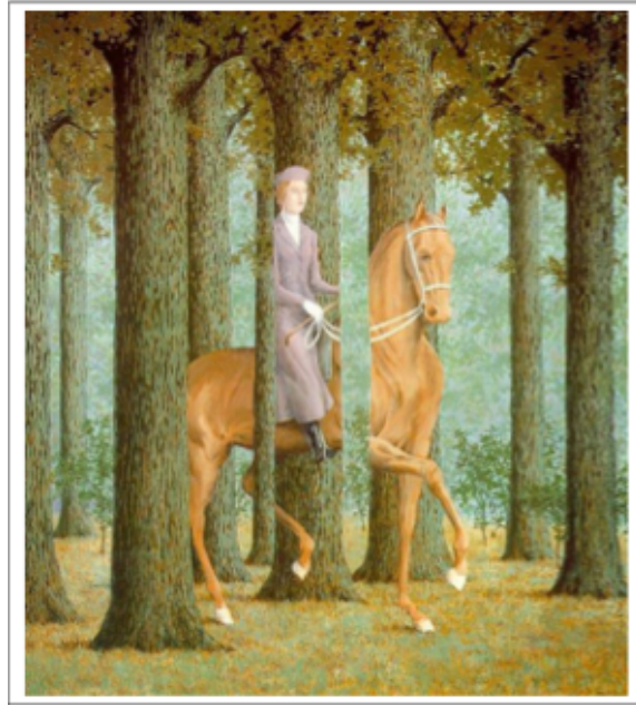
Doc 2 : René Magritte, le blanc-seing, 1965