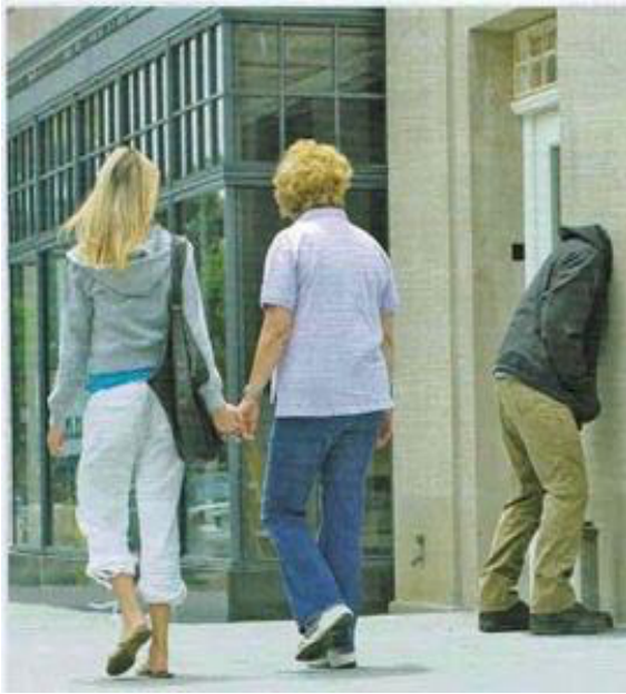
Doc 1 : Mark Jenkins, Embed Series, 2006

Objectif : S'interroger sur les limites entre le réel et l'étrange